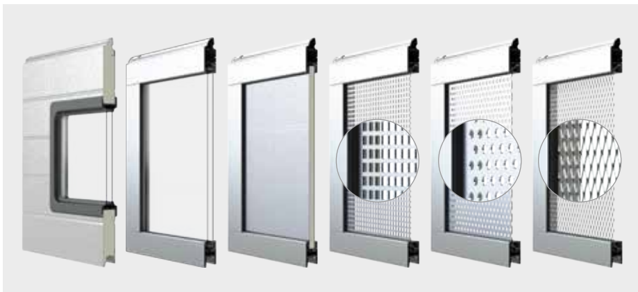
PANOURI PERSONALIZATE (de la stânga la dreapta): IS/IA cu fereastră, IP cu vitrare dublă, IP cu pauză termică, IP cu tablă perforată, IP cu plasă din aluminiu

Panourile din oțel cu ferestre sau panourile vitrate din profile din aluminiu reprezintă o soluție practică. Vitrarea poate fi simplă sau dubla cu plexiglas normal sau rezistent la abraziune. Ușile secționale industriale cu secțiuni vitrate pot deservi ateliere auto, spații comerciale sau pot separa discret spații din aceeași clădire, fiind disponibile cu sticlă acrilică mată, colorată sau sablată.