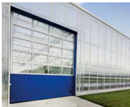
USA SECȚIONALĂ INDUSTRIALĂ K2 IM panou din oțel tip Microprofile cu panouri vitrate