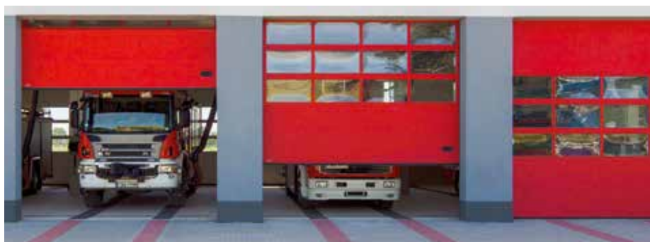
USA SECȚIONALĂ INDUSTRIALĂ K2 IA aluminiu cu panouri vitrate