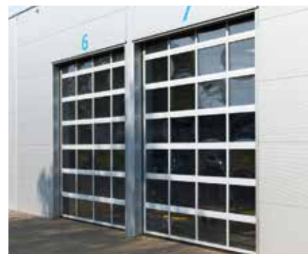
USA SECȚIONALĂ INDUSTRIALĂ K2 IP numai din panouri vitrate