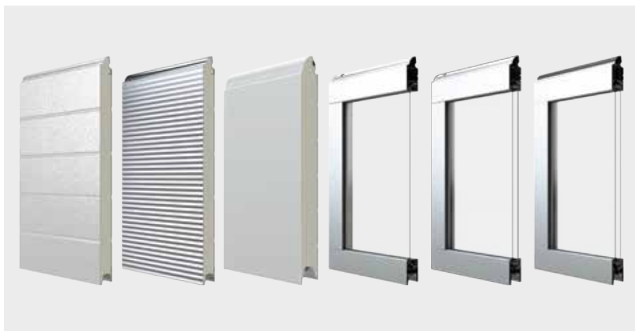
PANOURI PENTRU UȘILE SECȚIONALE (de la stânga la dreapta): Panel IS/IA, Panel IM, Panel IRFS 60, Panel IPS, Panel IPD, Panel IPT

Secțiunile de ușă au o grosime de 40 mm și sunt umplute cu spumă poliuretanică. Ușile K2 IRFS 60, K2 IRCS 60 sunt recomandate pentru clădirile care necesită izolare termică ridicată. Sunt construite din panouri simple de 60mm și au un sistem dezvoltat de etanșare perimetrală - etanșarea dublă pe panoul inferior și etanșarea laterală cu două buze. În afară de tipul de usi din oțel , comercializăm de asemenea ușile din aluminiu K2 IA și K2 IP. Ușile K2 IA cu relief îngust arată identic cu omologul lor din oțel K2 IS, dar sunt mai ușoare și au o clasă mai mare de rezistență la coroziune. Ușile K2 IP reprezintă o alternativă interesantă pentru ușile pline. Sunt caracterizate de un design modern, ele expun interiorul clădirilor și oferă mai mult lumina zilei înăuntru.